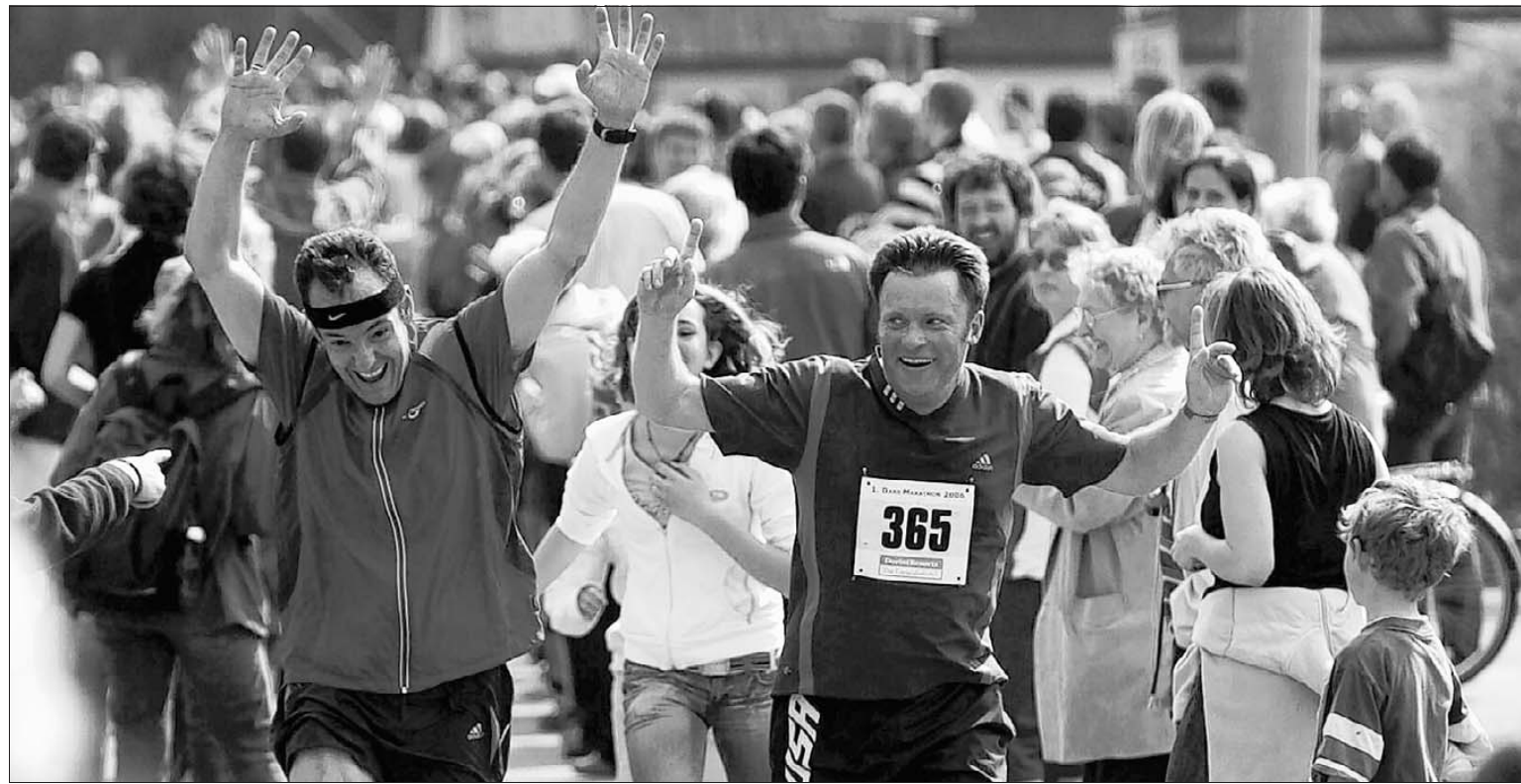
Begeisterung am Ziel beim ersten Darß-Marathon. Die Premiere der Veranstaltung am 7. Mai war ein voller Erfolg, der Lust auf mehr machte. Im kommenden Jahr soll es eine weitere Auflage des Natur-Erlebnis-Marathons an der Ostseeküste geben.

Leserservice: 01 802 - 381 365* Anzeigenannahme: 01 802 - 381 366* Ticketservice: 01 802 - 381 367* Fax: 01 802 - 381 368* (*6 Cent/Gespr.) Montag bis Freitag: 7 bis 20 Uhr, Sonnabend: 7 bis 13 Uhr.